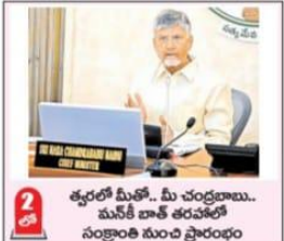
త్వరలో మీతో.. మీ చంద్రబాబు.. మనకి బాకీ తరవతో సంస్థానికీ మంచి ప్రైరంభం