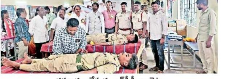
రక్తదానం చేస్తున్న ఎన్ఎస్సీ క్యాడెట్లు