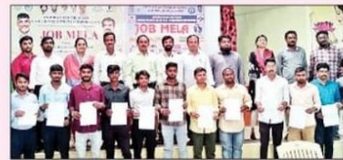
ఉద్యోగాలకు ఎంపికైన వారికి నియామక పత్రాలు అందజేస్తున్న దృశ్యం