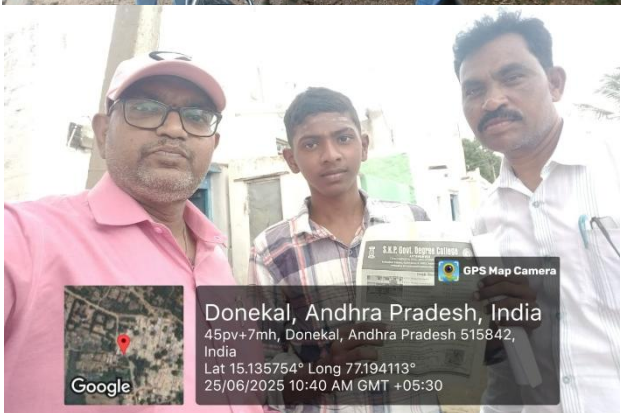
Donekal, Andhra Pradesh, India 45pv+7mh, Donekal, Andhra Pradesh 515842, India Lat 15.135754° Long 77.194113° 25/06/2025 10:40 AM GMT +05:30