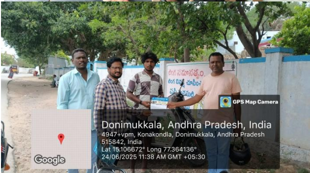
Donimukkala, Andhra Pradesh, India 4947+vpm, Konakonda, Donimukkala, Andhra Pradesh 515842, India Lat 15.106672° Long 77.364136° 24/06/2025 11:38 AM GMT +05:30