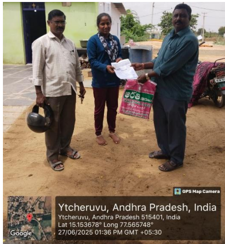
Ytcheruvu, Andhra Pradesh, India Ytcheruvu, Andhra Pradesh 515401, India Lat 15.153678° Long 77.565748° 27/06/2025 01:36 PM GMT +05:30