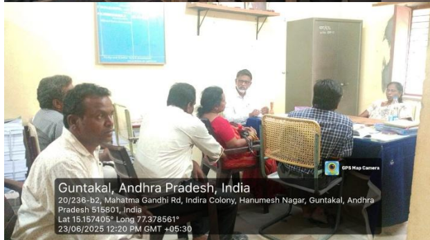
Guntakal, Andhra Pradesh, India 20/236-b2, Mahatma Gandhi Rd, Indira Colony, Hanumesh Nagar, Guntakal, Andhra Pradesh 515801, India Lat 15.157405° Long 77.378561° 23/06/2025 12:20 PM GMT +05:30