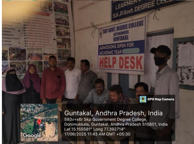
Guntakal, Andhra Pradesh, India 593v+x6r Skp Government Degree College, Donimukkala, Guntakal, Andhra Pradesh 515801, India Lat 15.155581° Long 77.392714° 17/06/2025 11:43 AM GMT +05:30