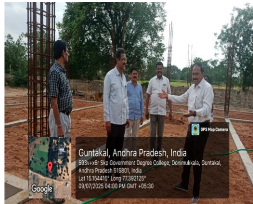
Quality Check Inspection