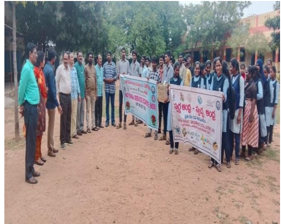
3 rd Saturday SASA