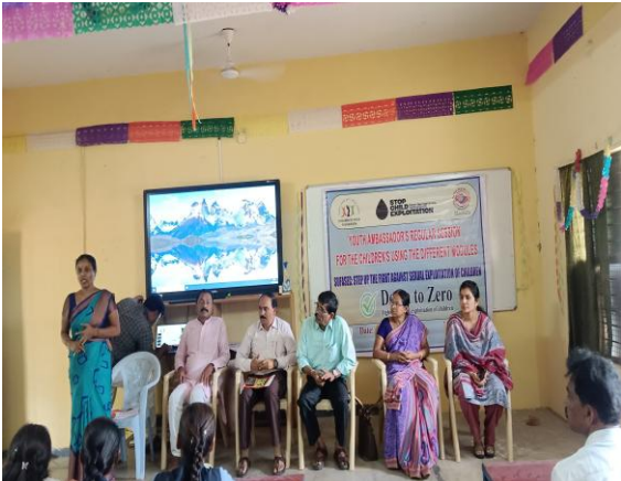
World Population Day