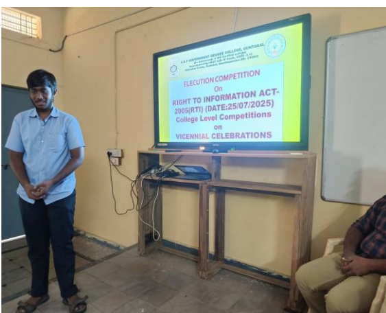
Competitions on RTI Act