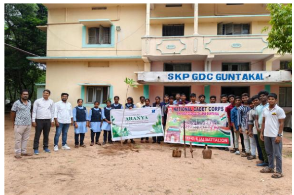
Project Aranya Plantation