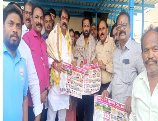
Admission Poster Release