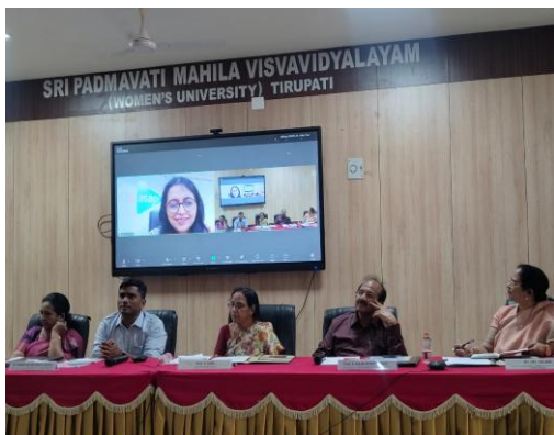
DCE Meeting with Principals