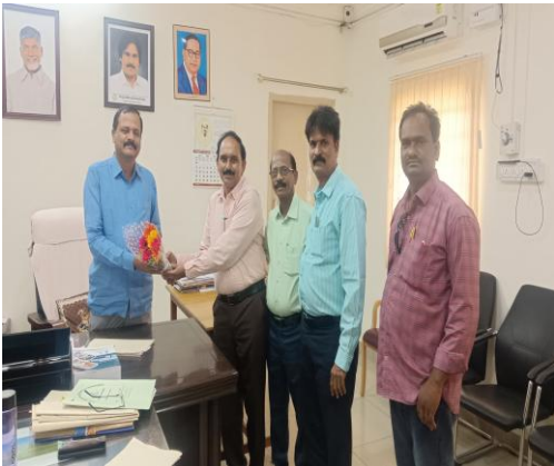
Meeting with Registrar