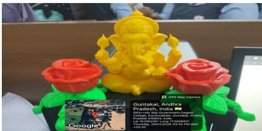
3D PRINTING IMAGES