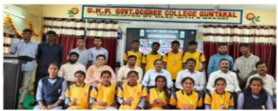
గుంతకల్లు జనవరి 5 (ప్రజా జ్యోతి):