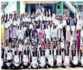
ఏజ్ ప్రవేశాలు అందుకున్న విద్యార్థులు, సిబ్బంది