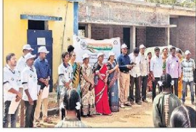
అవగాహన కల్పిస్తున్న తహసీల్దారు ఉపాధికారి

పెద్దపడుగుూరు: పట్టణ, గ్రామీణ ప్రాంతాల్లో 18 ఏళ్లు నిండిన ప్రతి ఒక్కరూ ఓటు హక్కు వినియోగం చుకోవాలని తహసీల్దారు ఉపాధికారి అన్నారు. పెద్దపడుగుూరు జెడ్పీ పాఠశాలలో శనివారం జాతీయ ఓటరు దినోత్సవం ఘనంగా నిర్వహించారు. విద్యార్థులతో కలిసి రాల్చి చేపట్టారు. ఆసంతరం ఉపాధికారి మాట్లాడుతూ సమర్థవంతమైన పాలన రావడానికి ఓటు సక్రమంగా వినియోగించాలని, ఓటు ప్రాధాన్యం అందరూ తెలుసుకోవాలని సూచించారు. సిబ్బంది, ఓపిఎల్ ఓటు పాఠశాలను, ఓటు హక్కు వ్యవస్థలను గుంతుకల్లుటోన్: ప్రజాస్వామ్యంలో ఓటు వజ్రాయుధమని ఎన్.కే.పీ ప్రభుత్వం (స్వయం ప్రతిపత్తి) డిగ్రీ